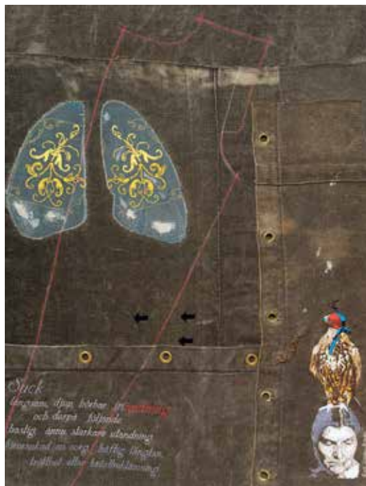
Inandning, handbroderi och datastyrt maskinbroderi på begagnad linneväv, 80 x 100 cm.

Värmlands Konstförening vill uppmärksamma och stödja ditt kreativa, sökande och berättande konstnärliga arbete med ett Thor Fagerkvist-stipendium.