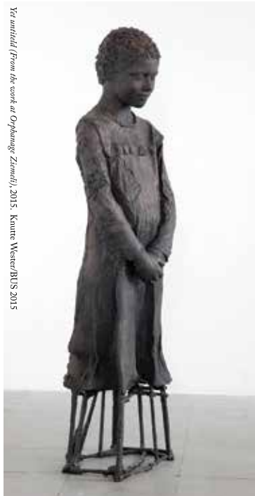
Yta utförd / From the work of Orphanage Zürichli, 2015. Knutte Wester/BRIS 2015

kristinehamnkonstmuseum.com 0550-882 00 En del av Kristinehamns kommun. Med stöd av Region Värmland.