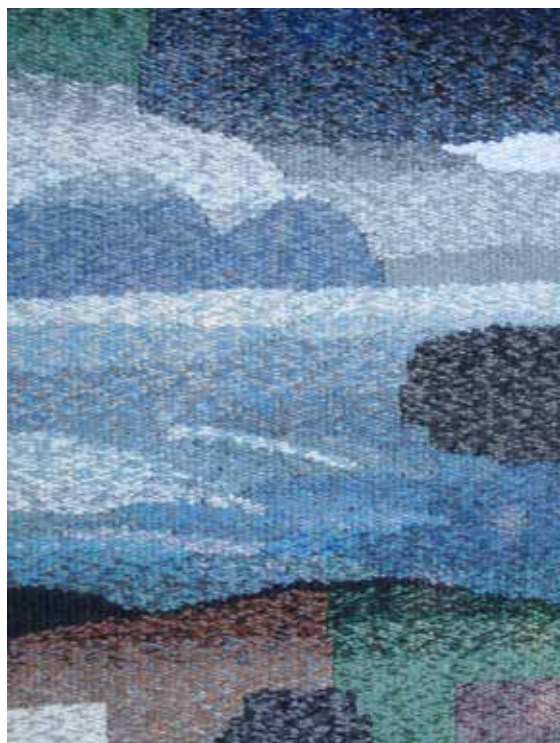
Touch of Iceland, bildväv, detalj

Värmlands Konstförening vill stödja din vistelse på det isländska textilcentret och ge dig Åke Lekmans resestipendium och önska dig lycka till i ditt sökande efter inspiration och nyorientering.