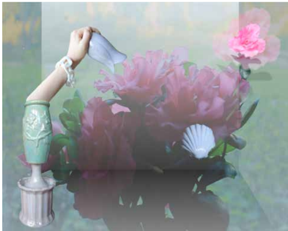
Stillbild ur videoverk, sekvens Hit by the indoor wind .

För att du ska kunna genomföra din omfattande arbetsprocess vill Värmlands Konstförening stödja dig ekonomiskt med Pingels ungdomsstipendium och önska dig lycka till i din konstnärliga utveckling.