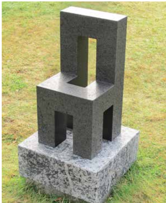
Stol, gabbro från Lappland, 60 x 30 x 30 cm

Värmlands Konstförening vill tilldela dig ett Thor Fagerkvist-stipendium som stöd och uppmuntran i ditt fortsatta hårda konstnärliga stenarbete.