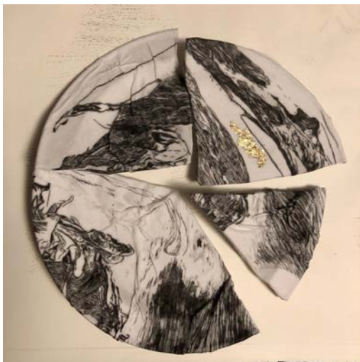
Dagboksblad. Väggsulptur, 25 cm i diameter.

För ett par år sedan sökte du äntligen medlemskap i Grafiska sällskapet och antogs självklart. Det ger dig tillträde till både nationella samlingsutställningar och de internationella sammanhangen. Vi gläds med dig åt dina framgångar och visar det gärna genom att tilldela dig vårt Thor Fagerkvist-stipendium.