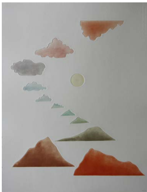
Thin air 18. Akvatintetsning, 51 x 39 cm.

Din hängivenhet för ditt ämne imponerar på oss och får oss att utse dig till 2024 års Åke Lekman-stipendiat – samt förstås att önska dig en fin och givande resa!