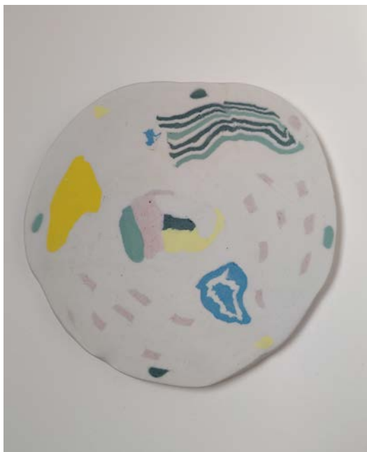
Ur Stillbilder. Porslinslera, cirka 12 cm i diameter.

Stipendiet du sökt ska användas till material och till mjukvara för datorn att göra animationen i. Vi bidrar gärna till ditt experimentella projekt och önskar lycka till!